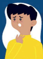
Dificuldade de respirar