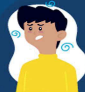
Falta de ar