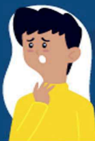
Dificuldade de respirar