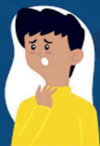
Dificuldade de respirar