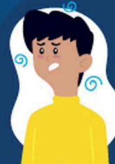
Falta de ar