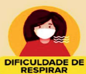
DIFICULDADE DE RESPIRAR